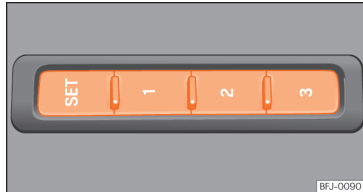
Abb. 1 Außen am Fahrersitz: Memorytasten

Mit den Memorytasten können Einstellungen für den Fahrersitz und die Außenspiegel gespeichert und wieder abgerufen werden.