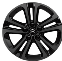
16-ZOLL-LEICHTMETALLFELGE STARLIT ONYX-SCHWARZ