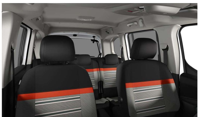
AMBIENTE LINE GREEN