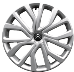
16-ZOLL-RADZIERBLLENDE TWIRL-BLACK CENTER