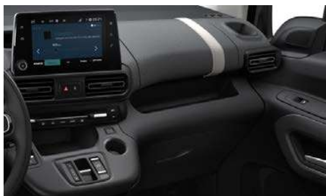
DEKORELEMENTE METROPOLITAN GREY (auf dem Armaturenbrett und den vorderen Türen)