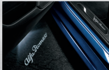
Einstiegsleisten aus Kohlefaser mit beleuchtetem Alfa Romeo Schriftzug sowie Einstiegsbeleuchtung