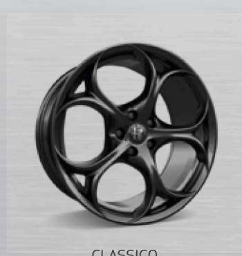
CLASSICO, dunkel lackiert