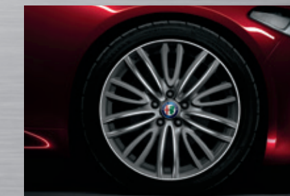
18"-Leichtmetallfelge 8J x 18 H2 ET33

Die gezeigten Farben können aus drucktechnischen Gründen von den Originalfarben abweichen.