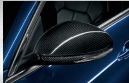
Außenspiegelkappen aus Kohlefaser