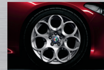
17"-Leichtmetallfelge 7,5J x 17 H2 ET33