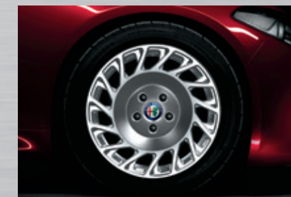
16"-Leichtmetallfelge 7J x 16 H2 ET25

1 Gegebenenfalls zusätzlich Einbau- und Montagekosten.