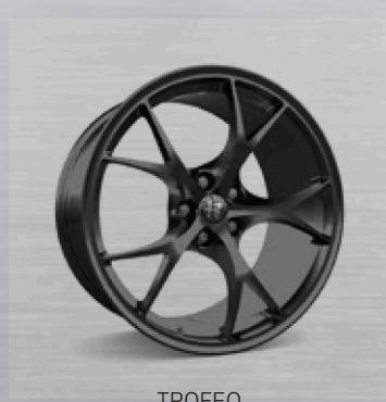
TROFEO dunkel lackiert