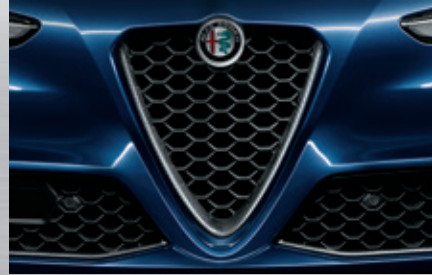
Kühlergrill (Scudetto) mit Kohlefasereinsatz