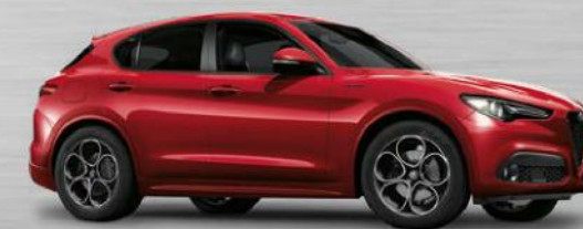
361 Rosso Competizione