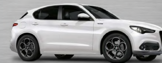
248 Bianco Trofeo