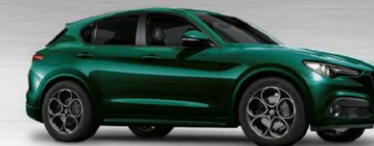
800 Verde Visconti