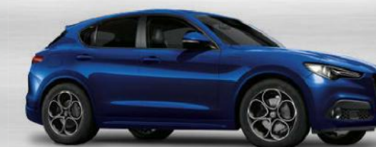
486 Blu Anodizzato