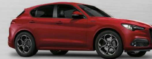
414 Rosso Alfa