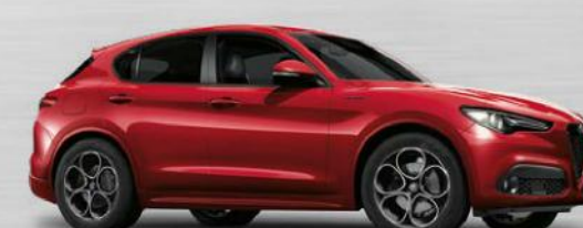
361 Rosso Competizione