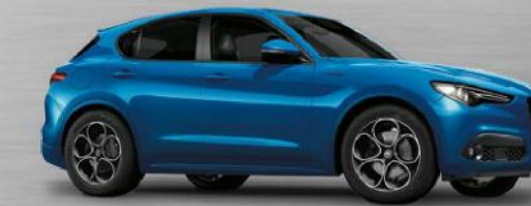
756 Blu Misano