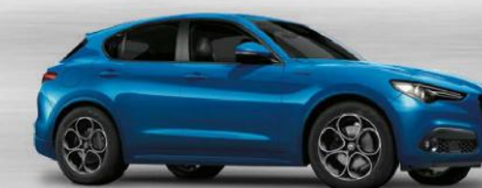
756 Blu Misano