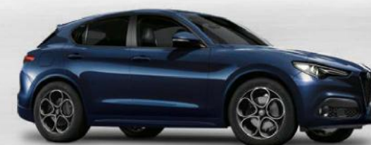
092 Blu Montecarlo