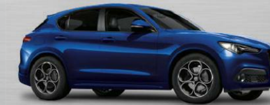
486 Blu Anodizzato