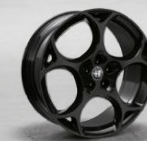
TURISMO, dunkel lackiert