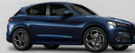
092 Blu Montecarlo