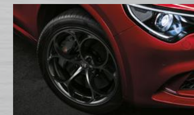
CLASSICO, dunkel lackiert