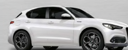
248 Bianco Trofeo