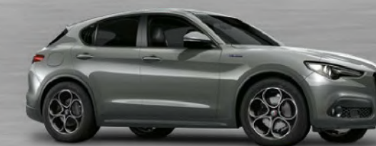
318 Grigio Stromboli