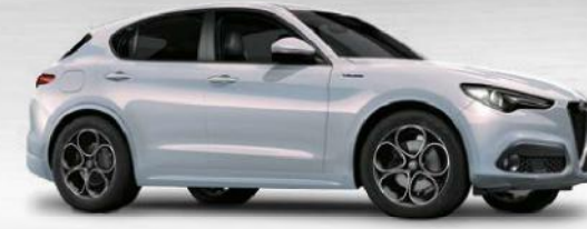
252 Perla Lunare