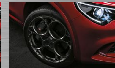
PROTOTIPO, dunkel lackiert