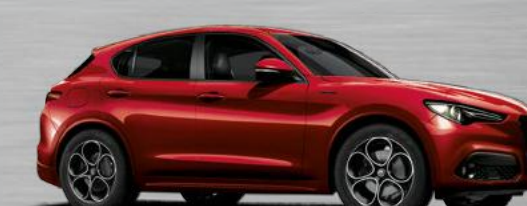
438 Rosso Villa D'Este