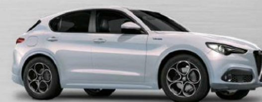
252 Perla Lunare