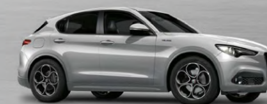
620 Grigio Silverstone