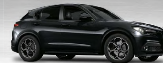
408 Nero Vulcano