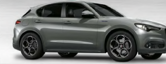
318 Grigio Stromboli