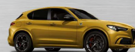
437 Ocra GT Junior