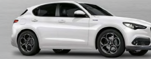
217 Bianco Alfa