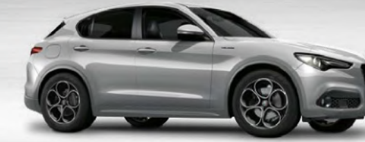
620 Grigio Silverstone