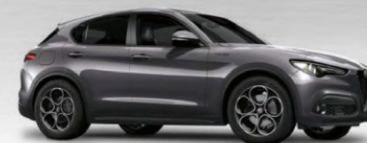
035 Grigio Vesuvio