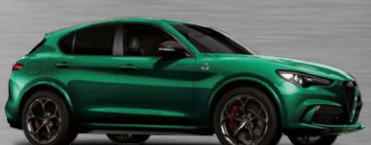
646 Verde Montreal