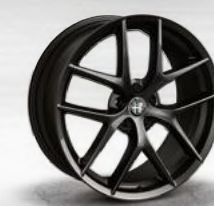
TROFEO, dunkel lackiert